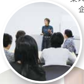
らら京都 創業スクールの授業風景

起業家を目指す女性のためのセミナーを開催しています。昨年開校の「らら京都創業スクール」では、女性たちが楽しみながらマーケティングの基礎知識から資金調達、ビジネスモデルの作成まで幅広い知識を学び、創業の実践力を身につけました。この取り組みは全国の創業スクールの中から中小企業庁の「創業スクール10選」に選ばれました。