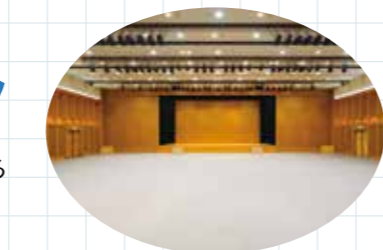
スクール型式 150名プランレイアウト (1人掛け9列×17列)