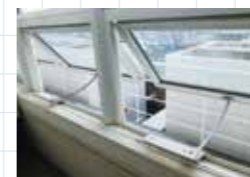
スポーツホール内 窓の開放