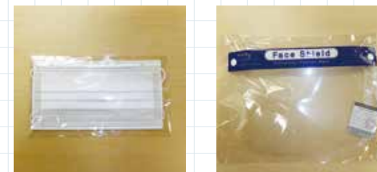
マスク 1枚 50円(税込) フェイスシールド 1枚 150円(税込)