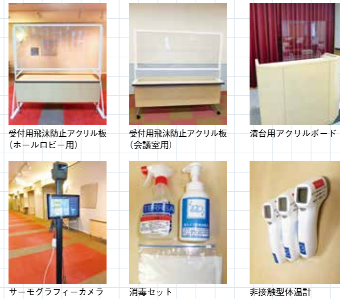
受付用飛沫防止アクリル板（ホールロビー用） 受付用飛沫防止アクリル板（会議室用） 演台用アクリルボード サーモグラフィーカメラ（ホールロビー用） 消毒セット 非接触型体温計 ※数に限りがございます。詳細はお問い合わせください。