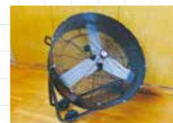
スポーツホール内 大型扇風機