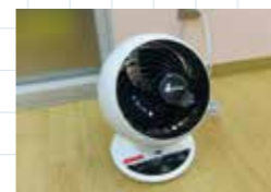
更衣室内サーキュレーター