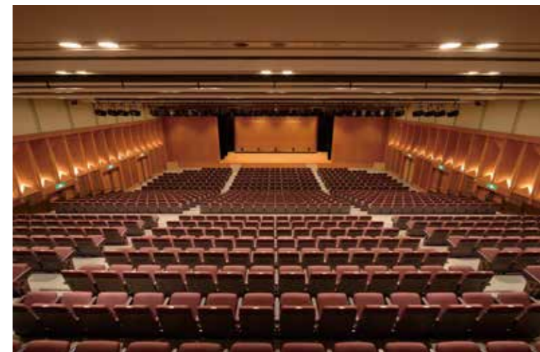
座席をすべて出した状態のシアター形式は 856 人の収容が可能

シアター形式で最大 856 席を有する京都有数の規模のホールです。全座席を収納すれば 555㎡のフラットスペースにもなり、またスクール形式やパーティー形式も可能で、コンサートや発表会、国際的な学術会議など、さまざまなことにお使いいただける多目的ホールです。