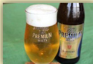
プレミアムモルツ 700円