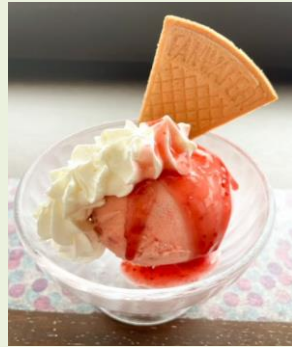
ストロベリーアイス 550円