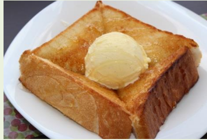
ハニートースト 550円