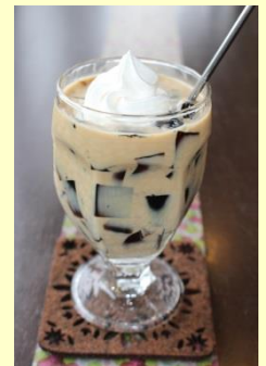
カフェオレゼリー