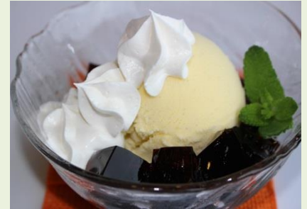
アイス in ゼリー 650円