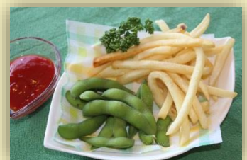
おつまみ 500円 (内容が替わる場合があります)