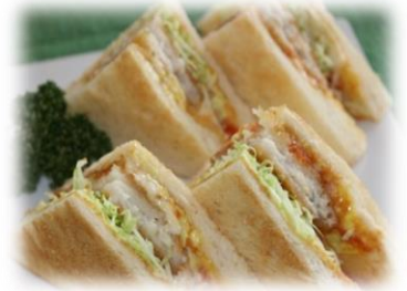
フィッシュカツサンド 850円