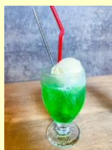
クリームソーダ(メロン・ブルーハワイ・ストロベリー)