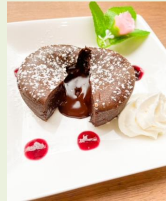
フォンダンショコラ 600円