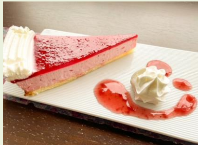
ストロベリーケーキ 600円

ドリンクセット…コーヒー(Hot/Ice)・紅茶(Hot/Ice)・りんご・オレンジ 250円