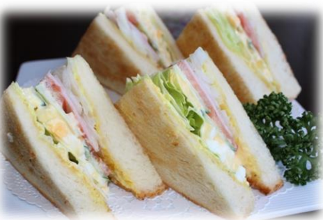
ミックスサンド 720円