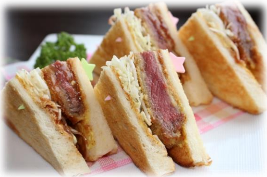
ビフカツサンド 1200円

注文いただいてから焼くホットサンド。香ばしく焼けたパンとそれぞれの新鮮具材が織りなすハーモニー。ジューシー、ふわふわ、シャキシャキ、とろ〜り、お好みの食感をどうぞ。